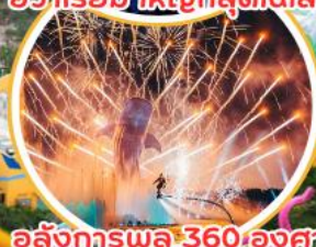
อลังการพลุ 360 องศา