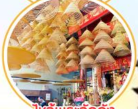
ของขวัญระวัดดัง