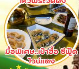
มือพิเศษ...เป่าอ้อ ซีฟูด ไวน์แดง